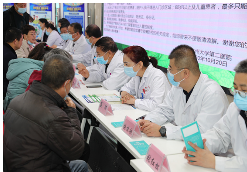
10月29日是第15个“世界卒中日”,为帮助广大群众加强对脑卒中的认识,对脑卒中做到早预防、早发现、早诊断、早治疗,我院在门诊大厅组织开展“世界卒中日”大型义诊宣传活动。

业,面对突如其来的新冠肺炎疫情,广大医学教育工作者展现出了双重身份,既能奔赴武汉挡在抗击新冠肺炎疫情的最前线,又在全面复工复产复学后迅速投入到医学教育事业当中,赢得了全社会的和学生群体的广泛赞誉和普遍尊重。希望大家继续发扬爱岗敬业、无私奉献的高尚风范,在做好临床医疗、科研工作的同时,以传道受业解惑为己任,努力为社会培养出更加优秀的医学人才,为兰州大学的医学教育发展作出更大贡献。