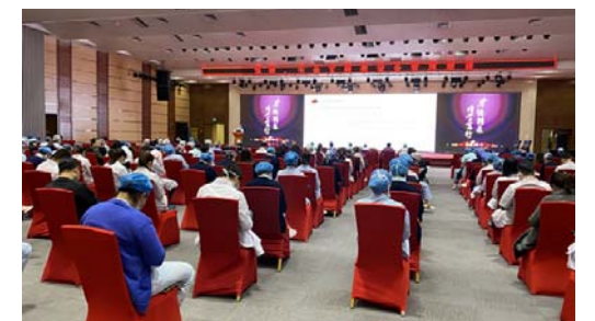
▲设备处开展三甲评审相关培训