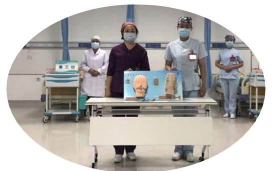
▲医院开展管道专科学组走进手术室活动