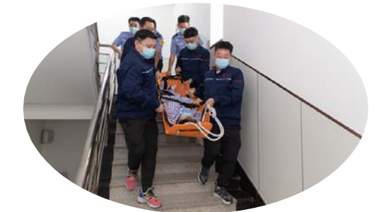
▲保卫处开展2020年度消防应急疏散演练