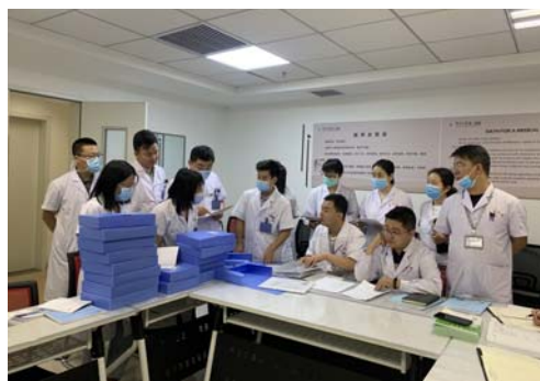
▲三甲办工作人员深入临床一线开展督查工作