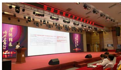
▲护理部开展第二次三甲培训