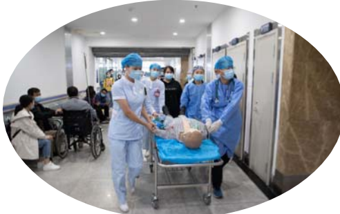
▲门诊部开展急救应急演练