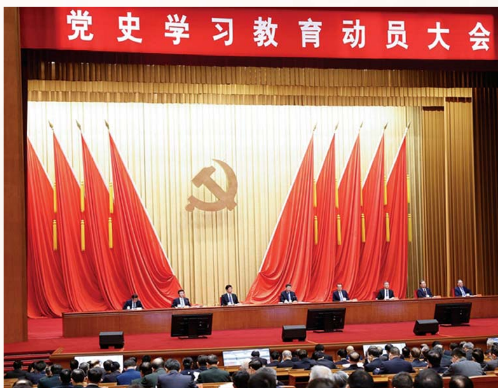
▲2月20日,党史学习教育动员大会在北京召开。中共中央总书记、国家主席、中央军委主席习近平出席会议并发表重要讲话。

习近平强调,我们党的历史,就是一部不断推进马克思主义中国化的历史,就是一部不断推进理论创新、进行理论创造的历史。一百年来,我们党坚持解放思想和实事求是相统一、培元固本和守正创新相统一,不断开辟马克思主义新境界,产生了毛泽东思想、邓小平理论、“三个代表”重要思想、科学发展观,产生了新时代中国特色社会主义思想,为党和人民事业发展提供了科学理论指导。要教育引导全党从党的非凡历程中领会马克思主义是如何深刻改变中国、改变世界的,感悟马克思主义的真理力量和实践力量,深化对中国化马克思主义既一脉相承又与时俱进的理论品质的认识,特别是要结合党的十八大以来党和国家事业取得历史性成就、发生历史性变革的进程,深入学习领